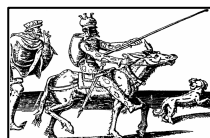
Teatro & Scuola

Centro Servizi Amministrativi di Bergamo